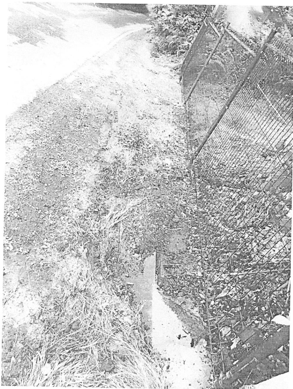
— IMG_2461.jpg —